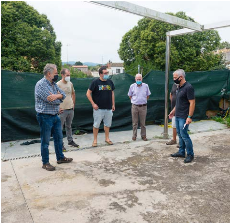
Els tècnics, visitant les obres de millora de la Llar de Jubilats.

Amb aquesta decisió culminava el procés impulsat per l'anterior equip de govern, que seguia la dinàmica dels anys anteriors. Per als propers anys, el procés de participació ciutadana en el marc dels pressupost participatius s'enfocarà de manera diferent, mitjançant la creació de diversos consells sectorials que es tindran en compte a l'hora de confeccionar els pressupostos, tal com s'ha fet per exemple amb la convocatòria d'ajudes per als sectors afectats per la Covid-19.