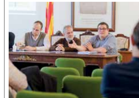
La presentació del Pla va tenir lloc el 19 de novembre passat.

Entre les accions proposades en el pla hi ha la singularització de les imatges comercials dels establiments, la millora de la senyalització dels recursos comercials i turístics, la pacificació del trànsit, potenciar el model de fires existents i el mercat setmanal, l'ocupació de locals buits, la creació de packs que vinculin comerç, estades i gastronomia, la creació de premis i la col·laboració públicoprivada, entre d'altres.