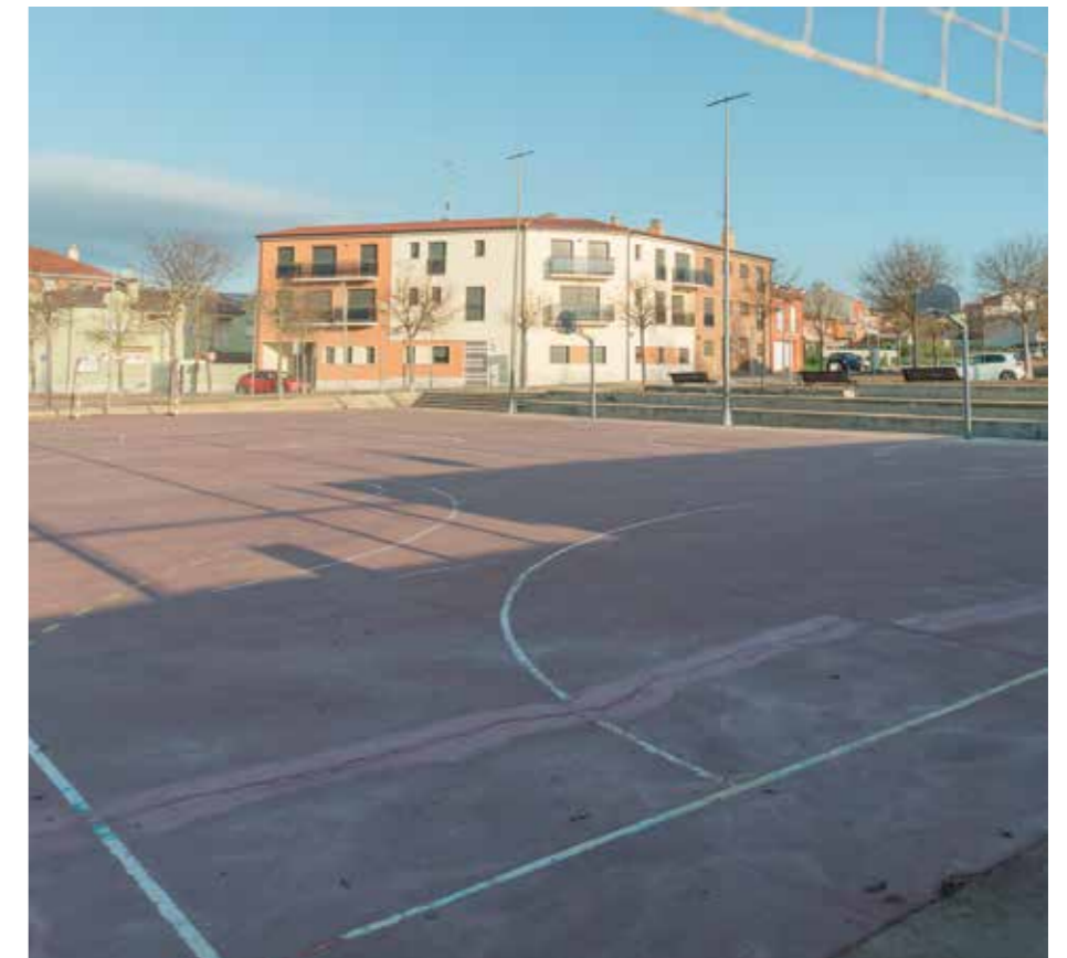
Les obres s'executaran abans d'acabar l'any

Concretament, hi ha prevista la substitució del paviment perimetral de formigó deteriorat; la reparació de les fissures existents en el paviment; l'aplicació de pintura especial, tant a la pista com a la vorera perimetral; el repintat de les ratlles de jocs —futbol sala-handbol i 2 minibàsquets—; la substitució de les dues porteries actuals per dues d'antivandàliques així com la instal·lació d'una taula de ping-pong.