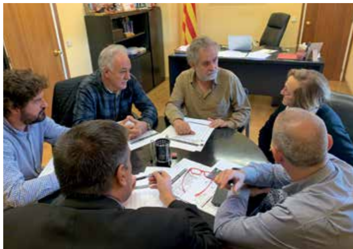
Els alcaldes, reunits per demanar millores.

Els set ajuntaments han acordat demanar formalment al Consorci del Transport Públic de l'Àrea de Girona, Autoritat Territorial de Mobilitat (ATM) la modificació d'alguns traçats de les actuals línies de transport regular per tal que facin parada directe a l'Hospital Santa Caterina, ubicat al Parc Hospitalari Martí i Julià de Salt.