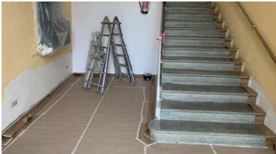
Les obres de la nova plataforma elevadora a l'Ajuntament.