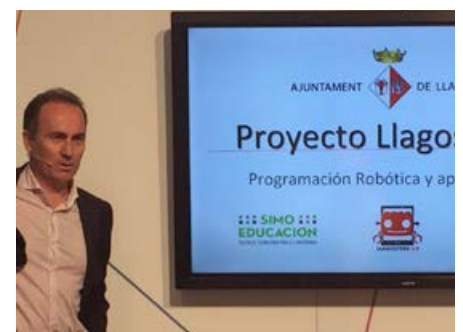
[Foto 1] Un moment de la presentació a l'Ajuntament de Llagostera.