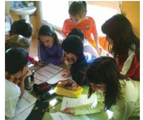
Els alumnes dels centres han treballat de valent per contribuir a l'estalvi energètic de la seva escola.

Les escoles de Llagostera van aconseguir, durant el curs 2013-2014, estalviar 28,1 tones de CO 2 amb l'aplicació de bones pràctiques d'eficiència energètica, gràcies al projecte Euronet 50/50. Enguany, els centres tornen a participar en aquesta iniciativa. Serà el segon cop que l'escola Puig de les Cadiretes treballi en aquesta proposta educativa d'estalvi energètic, mentre que l'escola Lacustària hi participarà per primera vegada.