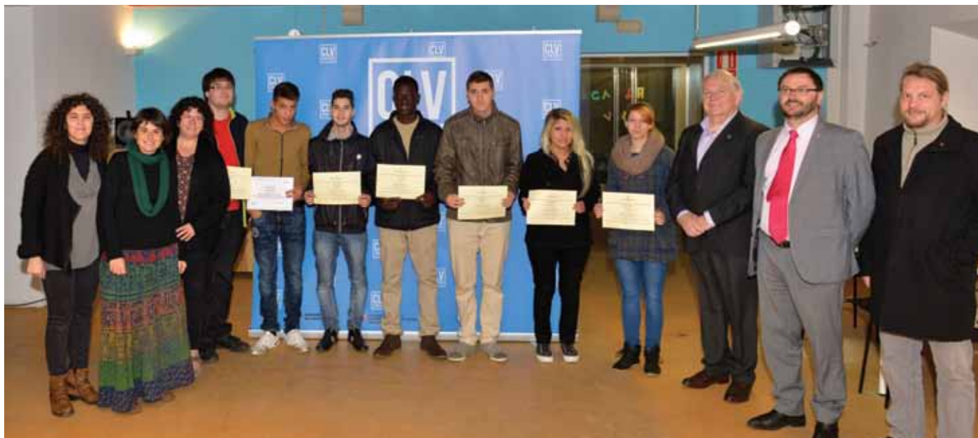
Els participants en el programa, amb el seu diploma.