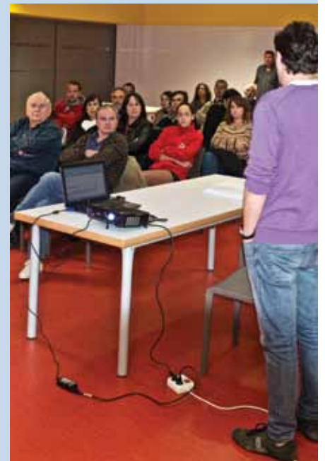
En total, s'han recollit 42 propostes ciutadanes.

En total, s'han recollit 42 propostes agrupades en 4 grans àmbits, que fan referència, bàsicament, a les persones, l'urbanisme i el medi ambient, l'economia i la promoció del municipi de Llagostera. Totes les propostes recollides han estat analitzades per l'equip de govern per tal de valorar-ne la viabilitat i, si escau, incorporar-les al pressupost municipal.