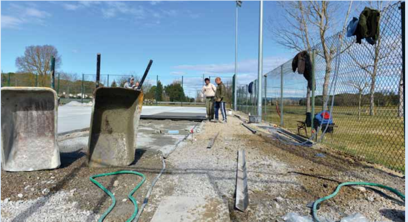
Les obres per millorar les pistes de tennis.

S'ha canviat el paviment, que es trobava en mal estat, i s'ha substituït el sistema de xarxes