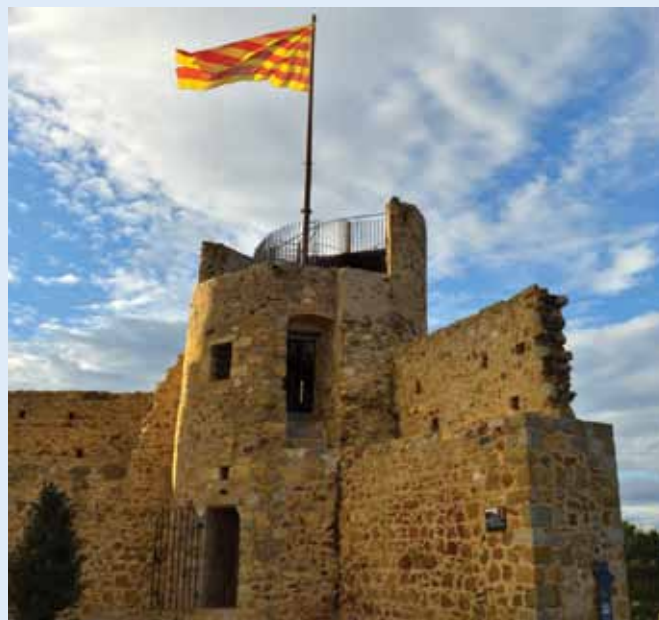
Un mirador privilegiat sobre Llagostera.

Llagostera segueix treballant per ampliar els atractius turístics i complementar l'oferta del nucli antic del municipi. Des de finals del 2014 s'ha obert al públic el mirador de la torre de la presó, que posa en valor la qualitat paisatgística del municipi i el seu patrimoni històric. Les obres han consistit en la instal·lació d'una plataforma metàl·lica a la part superior de la torre, a la qual s'accedeix a través d'una escala de cargol des de l'interior de l'edificació. Amb una alçada de 8 metres per sobre el nivell de la plaça del Castell i a 171 metres per sobre del nivell del mar, Llagostera disposa d'un nou mirador privilegiat de les Gavarres. El projecte va néixer com una proposta del Pla estratègic