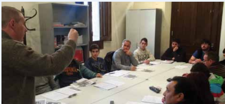
Un moment del curs de gestió d'estocs i magatzem