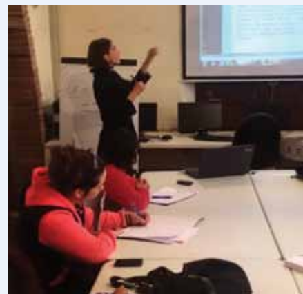
El curs sobre higiene personal del malalt enllitat va tenir molt bona acollida