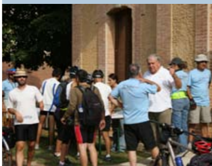
Els cicloturistes van fer parada a Llagostera

La darrera cita va ser una pedalada organitzada per les Vies Verdes i que va reunir unes 350 persones, que van sortir de Girona i van arribar a Sant Feliu de Guíxols. Aquesta excursió va servir per cloure el Congrés Internacional de Cicloturisme.