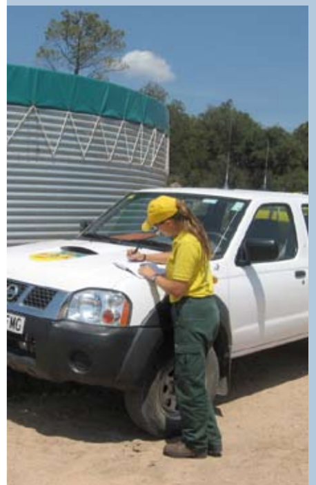
La tasca que realitzen els ADF és molt important per a la preservació dels boscos i zones rurals

La tasca que realitzen aquests vigilants és molt important. Durant aquests dos anys, han donat 47 avisos de columnes de fum, han fet la primera intervenció en 8 incendis i han donat suport a 11 sufocacions, i han recollit petits abocaments de deixalles en 32 ocasions. A més, cal destacar el suport als bombers i els agents rurals, així com la revisió dels dipòsits d'aigua per a extinció d'incendis, l'elaboració d'un inventari de masos allats, o altres tasques de prevenció i informació.