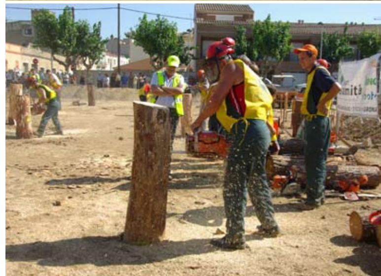
El concurs de tallar troncs va aixecar gran expectació

Llagostera participa en diferents pedalades per promoure el cicloturisme