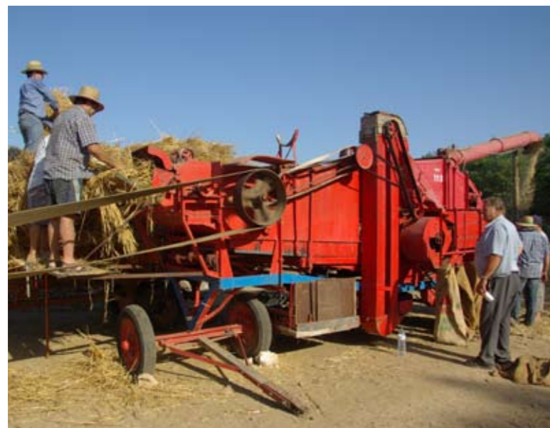
La Fira va acollir diferents demostracions

La fira es va celebrar al parc de l'Estació, amb una programació plena d'activitats per a tots els públics. L'acte central va ser la demostració de batre, fer el pallier i el concurs de tallar troncs. A més, es va dur a terme una Fira de Comerç, una demostració de gossos de caça i una tractorada de pagesos. La jornada es va completar amb la cercavila de gegants, actuacions musicals i diferents activitats infantils.