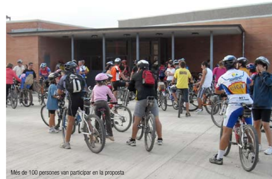
Més de 100 persones van participar en la proposta

Volem donar les gràcies a tots els participants que van voler sumar-s'hi i al Club BTT Llagostera per la bona organització i implicació en la jornada.