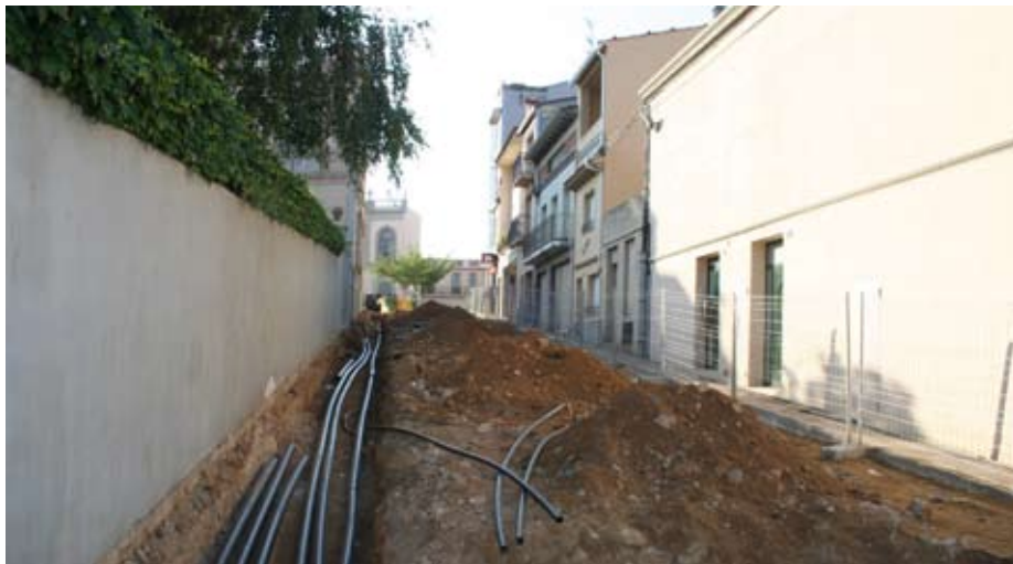
Les obres estan en marxa. A la foto, detall del carrer Jaume I.

Aquest projecte dona continuïtat al Pla d'Accessibilitat del Municipi i té com a objectiu millorar el sanejament i l'evacuació de les aigües plujanes i minimitzar les inundacions a la zona de la riera Gotarra, ja que es fa un col·lector de recollida i s'aboca l'aigua en el tram de riera que hi ha passat el pont de la carretera de Tossa.