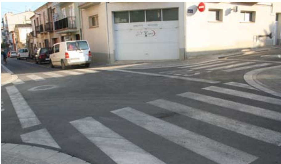
Les millores d'aquests carrers, al centre de Llagostera.

Això és possible gràcies al Pla d'Accessibilitat impulsat per l'Ajuntament de Llagostera, que ha previst la reforma total d'aquests carrers. Així, s'han ampliat voreres, s'han eliminat les barreres arquitectòniques, s'han soterrat tots els serveis, s'ha millorat el sanejament s'han separat les aigües pujanes de les aigües negres i s'han reasfaltat els carrers. En total, s'hi ha destinat un milió d'euros.