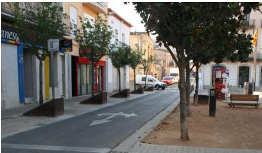
Passejar per aquesta zona és molt més agradable.