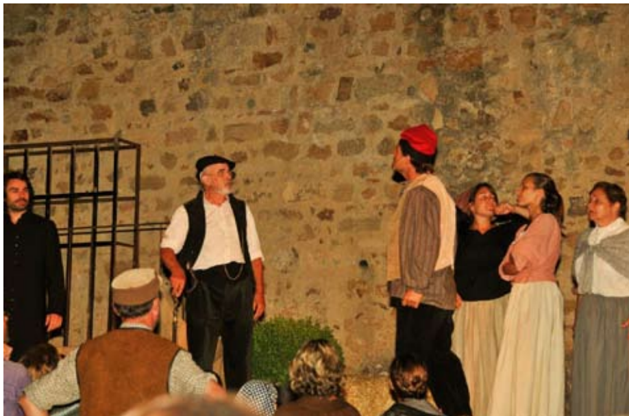
L'obra va aplegar una 50 d'actors de Llagostera.

L'espectacle, estrenat l'any passat, es va representar de nou a principis de juliol a la plaça Llibertat