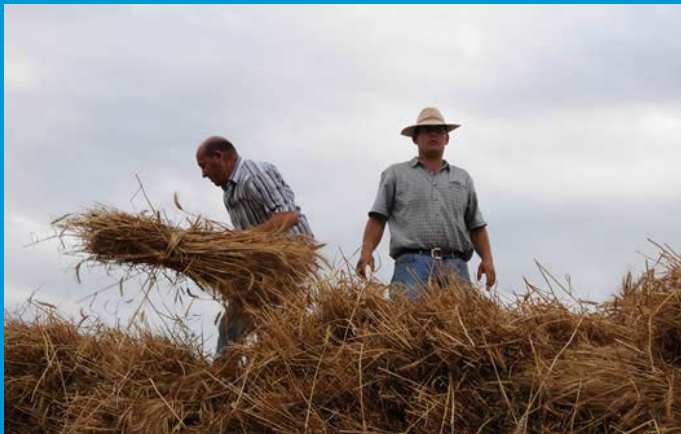
Es va fer diverses demostracions del segar.

A la festa del Batre està previst que es facin demostracions del batre i fer paller, exhibició que es completarà amb diverses activitats, com el concurs de tallada de troncs, un mercat d'artistes, cercavila de gegants, balls de bastons, espectacles musicals, etc. (Podeu veure la programació a la darrera pàgina d'aquest butlletí).