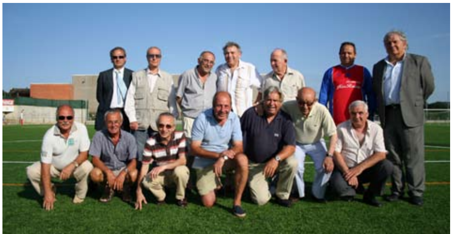
Diversos jugadors i directius que han passat per la U.E. Llagostera van rebre un merescut homenatge.

Els protagonistes de la jornada van ser els jugadors de totes les categories de la U.E. Llagostera. Al matí es van jugar diferents partits de futbol base de l'equip local contra el Riuprimer, mentre que a la tarda van tenir lloc els actes institucionals d'inauguració i un partit de veterans, que van rebre un merescut homenatge. La diada va cloure amb una botifarrada en la qual van participar els jugadors de totes les categories del club i els seus familiars.