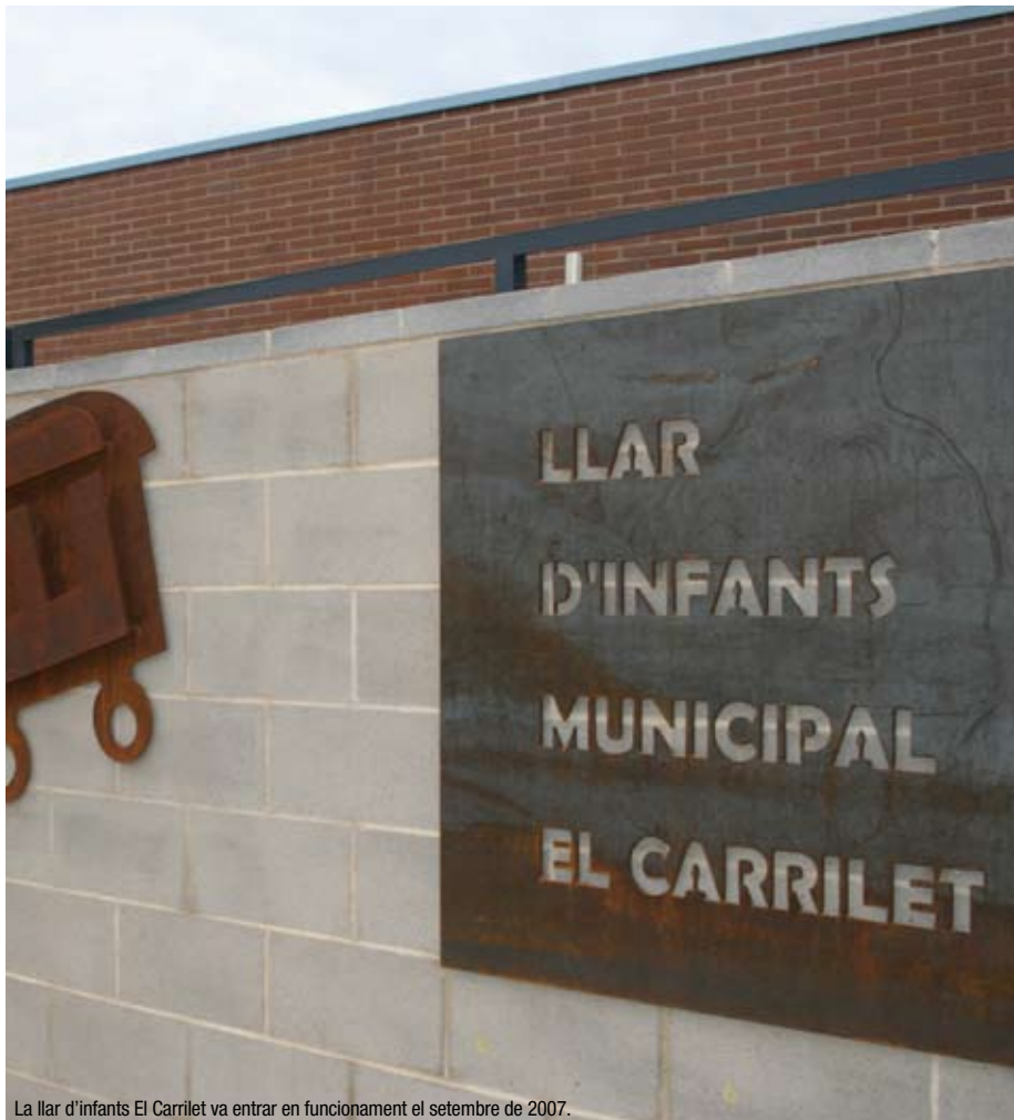
La llar d'infants El Carrilet va entrar en funcionament el setembre de 2007.

Finalment, El Carrilet acollirà 15 nens de P1, que es repartiran en tres aules; 42 nens a P2, que estaran també en tres aules, i l'aula de lactants. Aquest espai, que es va posar en funcionament el gener, està destinat inicialment als nadons de 4 a 12 mesos, i s'han inscrit quatre criatures. A aquestes, se n'afegeixen cinc més nascuts al desembre. En total, sumen nou nadons, el que compleix la ràtio de nens per classe que marca el Departament d'Ensenyament de la Generalitat.