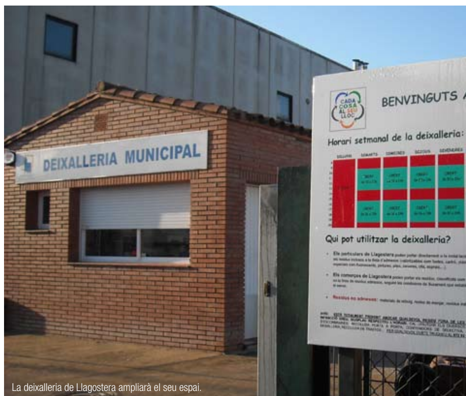
La deixalleria de Llagostera ampliarà el seu espai.

Per inscriure-us a la campanya i aconseguir un compostador i/o assessorament, podeu consultar la plana web www.llagostera.cat o bé trucar al telèfon 972 83 17 07.