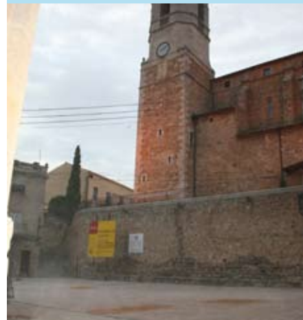
Les obres de la primera fase ja estan acabades.

Aquesta segona fase contempla l'adequació d'edificacions de la muralla, la reurbanització de carrers i el soterrament de serveis. El total de la iniciativa implica una inversió de 2,9 milions d'euros, 1,6 dels quals són del PUOSC i de l'1% cultural.