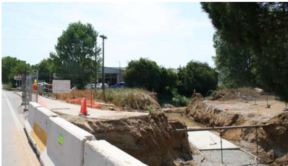
En aquest punt desembocaran les aigües plujanes amb l'objectiu de minimitzar el risc d'inundacions.

Les obres de la segona fase del nucli antic segueixen a bon ritme