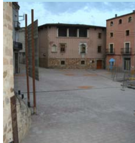
Aquesta actuació posa en valor el nucli antic.