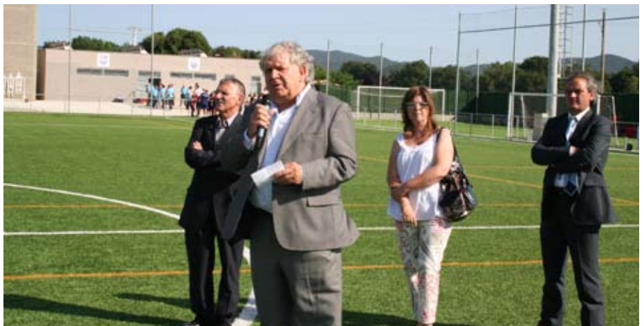
Un moment de la inauguració del camp.